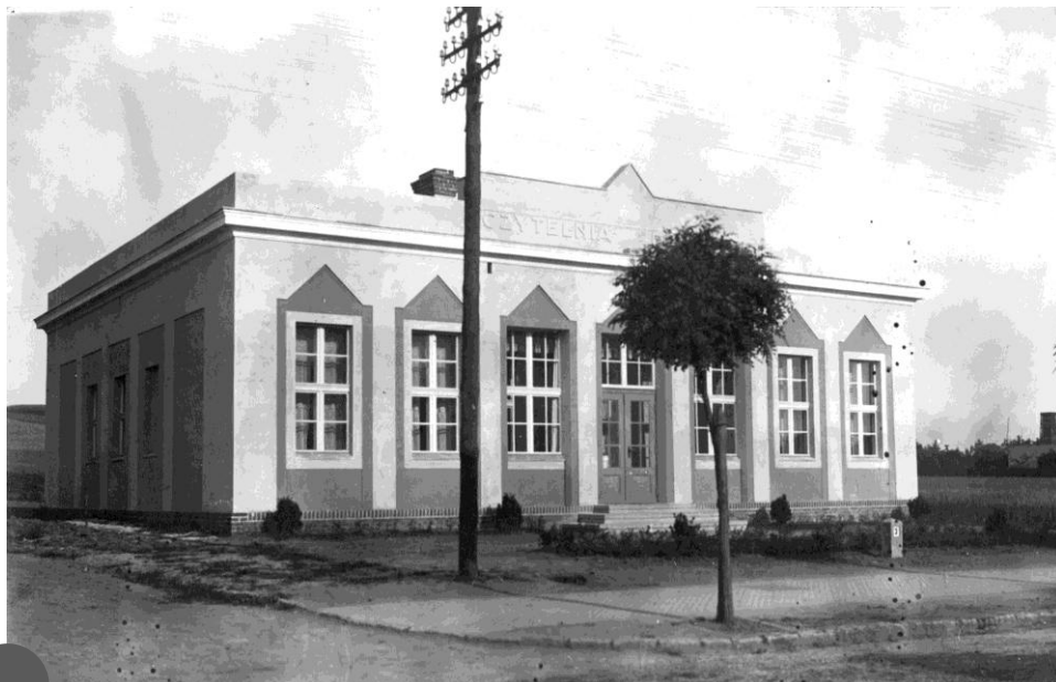
Siedziba Towarzystwa wzniesiona w 1934 roku