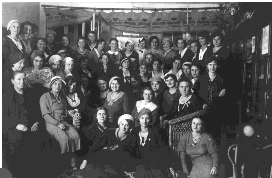
Członkinie Czytelni (1933)