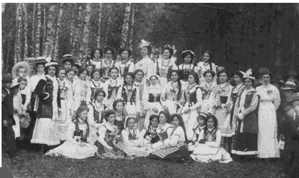
Członkinie Towarzystwa Czytelni dla Kobiet (1910)

Świętej Górze. Widocznie wówczas dalsze wyprawy nie cieszyły się powodzeniem.